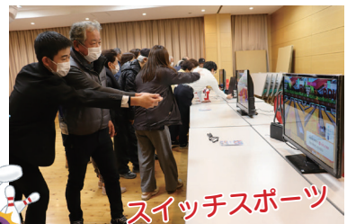
スイッチスポーツ