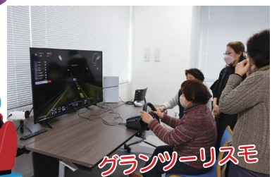
グランツーリスモ