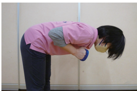
▲①重りを肩の近くに構える